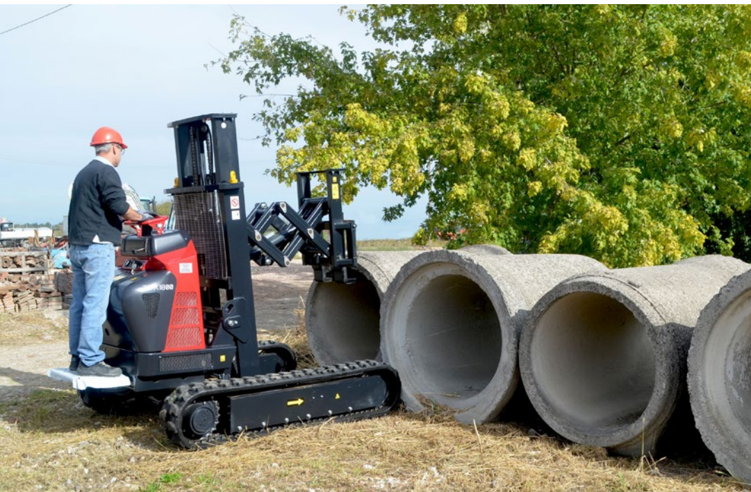
▼ Trasporto condotte in cemento circolari per acquedotti e fognature.