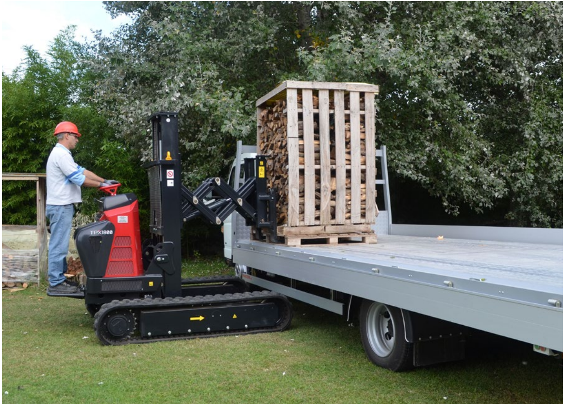
► Trasporto legna da ardere e pellets. Transporte de leña y pellets.